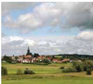
Blick auf Crainfeld.