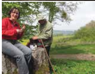
Tolle Aussichten sind ein Charakteristikum der Extratouren.